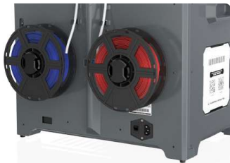
Spool Filament in the back