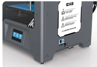
SD card printing