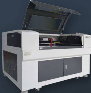
▶ RAY9 Smart CO 2 Laser