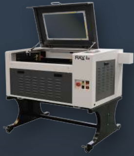
▶ RAY6 Smart CO 2 Laser