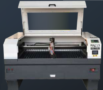
▶ RAY13 Metal Smart CO 2 Laser